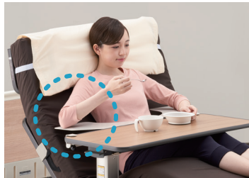
ポジショニングサポート 笑(エミ)テーブル