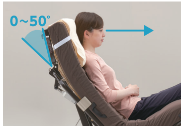
在宅介護向けベッド Emi (エミ)