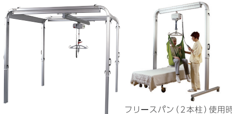
フリースパン（2本柱）使用時

天井や壁などの特別な工事は不要でリフトを利用することができます。最大可動幅5mまで対応可能。エリア内でご利用者様を自由に移動させることができます。ハンガーの取替えができるので、ハンガーとスリングの組み合わせで座位姿勢だけでなく「リクライニング姿勢」「臥位姿勢」での移乗も可能です。