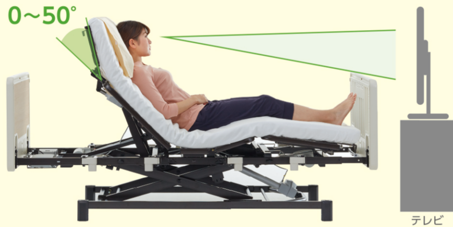
生活空間への視線となり、快適に