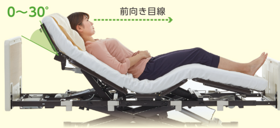
飲み込みに最適な、あごを引いた姿勢に

ベッド上で飲み込みに適したあごを引いた姿勢が取れて、誤嚥リスクの低減に繋がります。