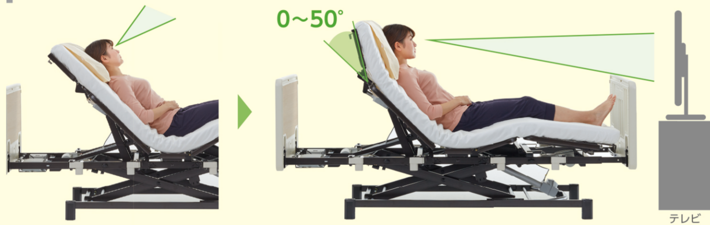
天井方向への視線が…

視線が前を向くため、ご家族とコミュニケーションが取りやすくTVも見やすいため、ベッドで快適にお過ごしいただけます。